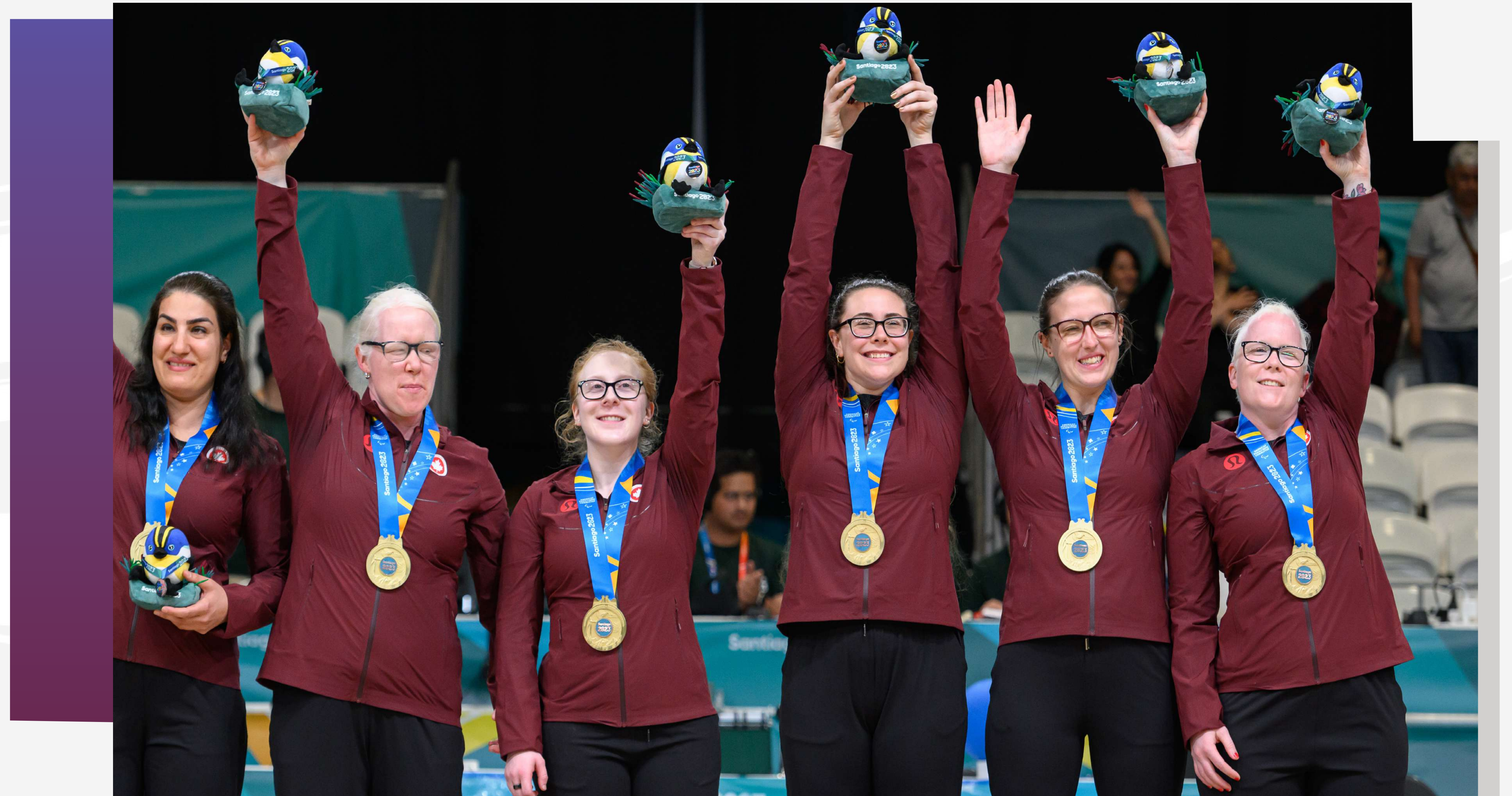
ÉQUIPE FÉMININE DE GOALBALL Jeux parapanaméricains de Santiago

Et les athlètes ont pu alors se préparer pour les Jeux paralympiques Paris 2024 en sachant que leurs succès seraient considérés au même titre que ceux des médaillés olympiques canadiens.