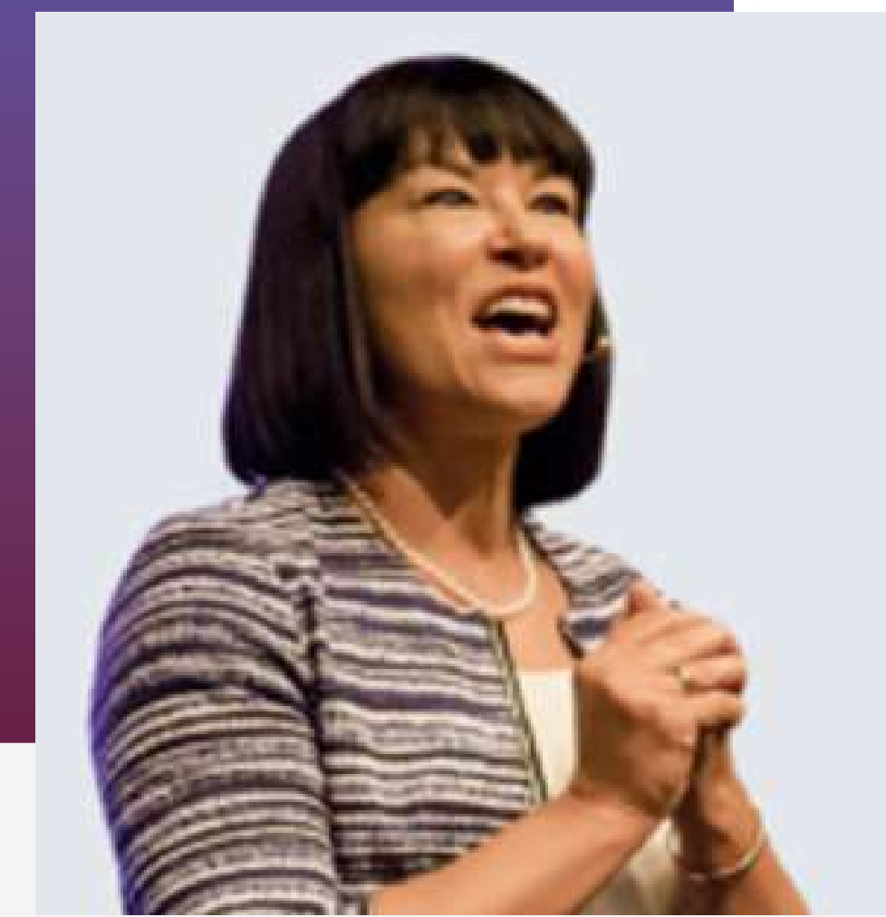
HON. CHANTAL PETITCLERC MEMBRE