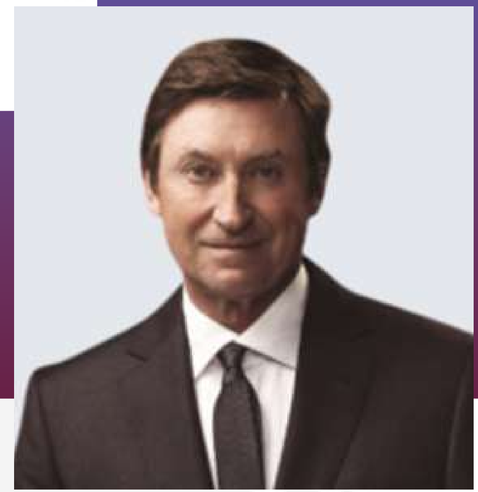
WAYNE GRETZKY MEMBRE