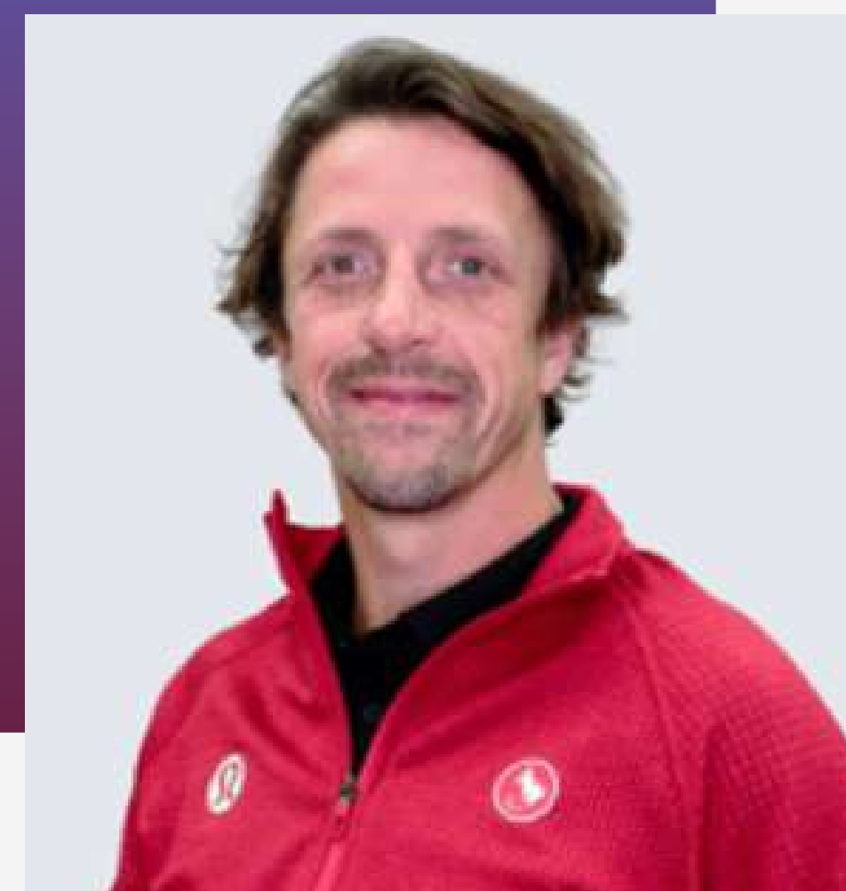
JOSH DUECK MEMBRE DU CONSEIL DES ATHLÈTES DE L'IPC