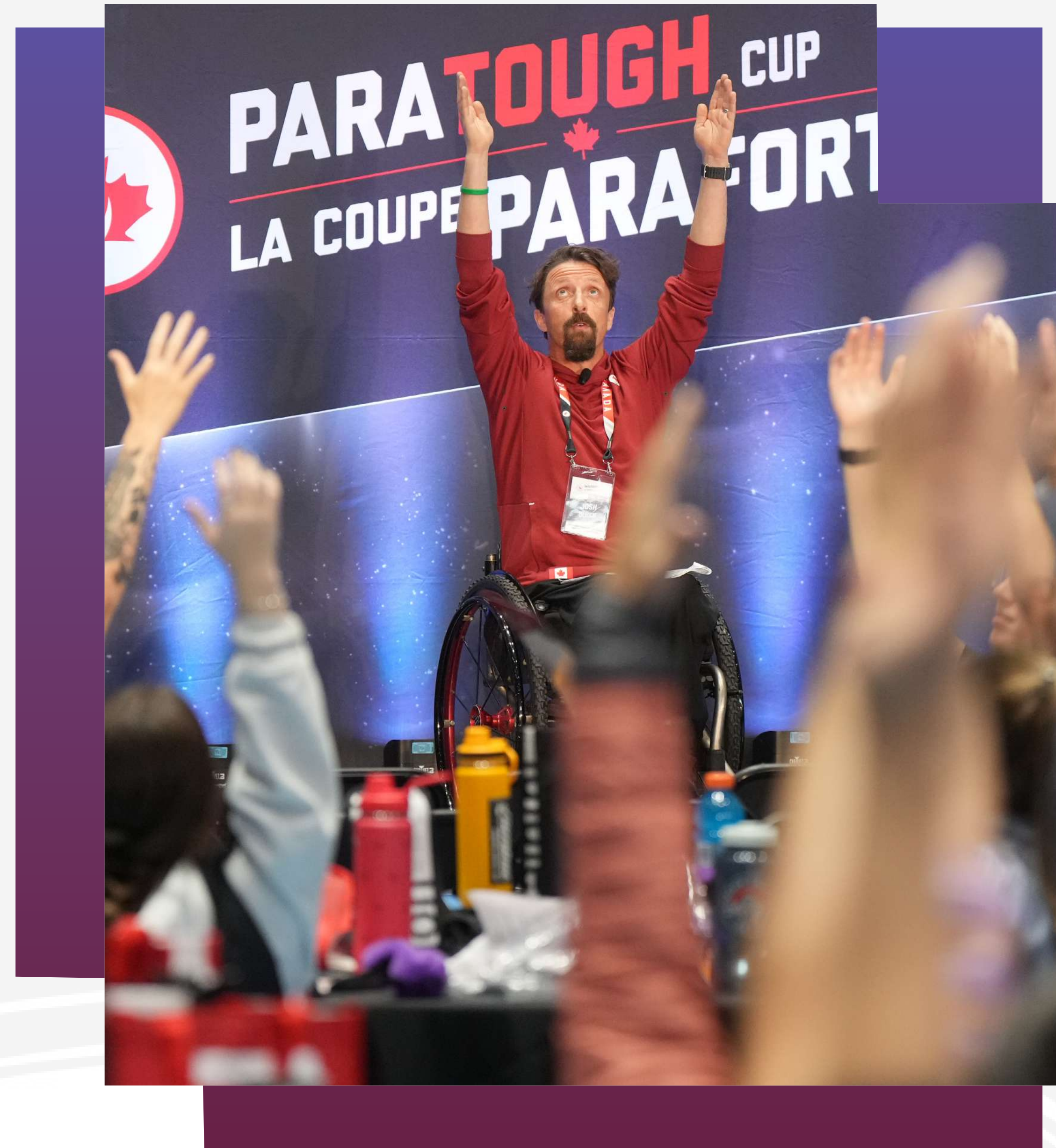
Le paralympien JOSH DUECK , anime les festivités de la Coupe ParaForts

la trousse d'Equipe Canada pour Paris 2024.