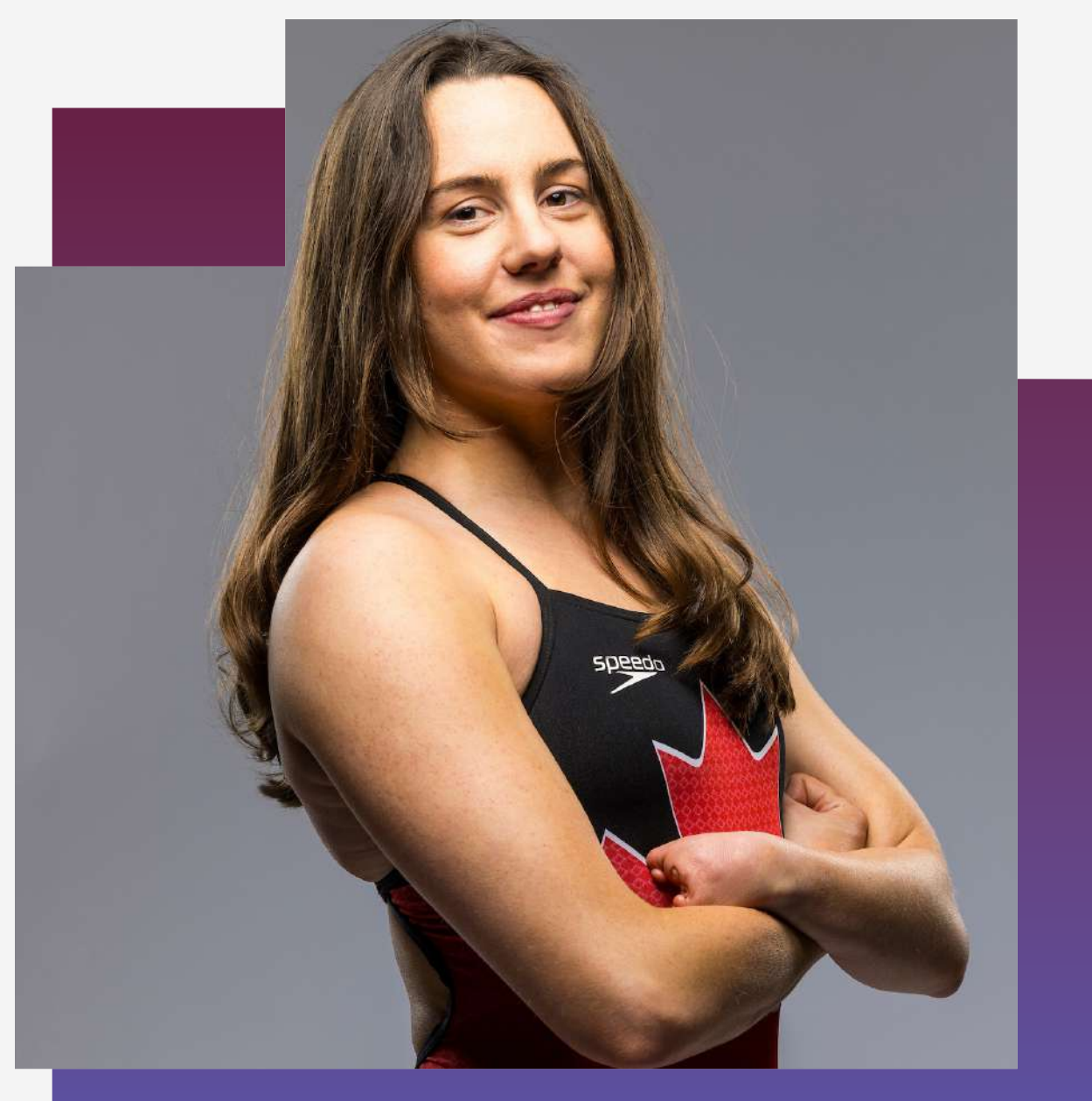
AURÉLIE RIVARD , Paracanotage

« L'annonce d'aujourd'hui, c'est bien plus que des simples nouvelles sportives. Nous prenons la décision, comme pays, de valoriser et d'appuyer de la même manière les athlètes qui représentent le Canada, quelles que soient leurs différences. Je pense qu'il s'agit d'un grand pas en avant vers l'idée qu'une médaille paralympique a la même valeur qu'une médaille olympique. »