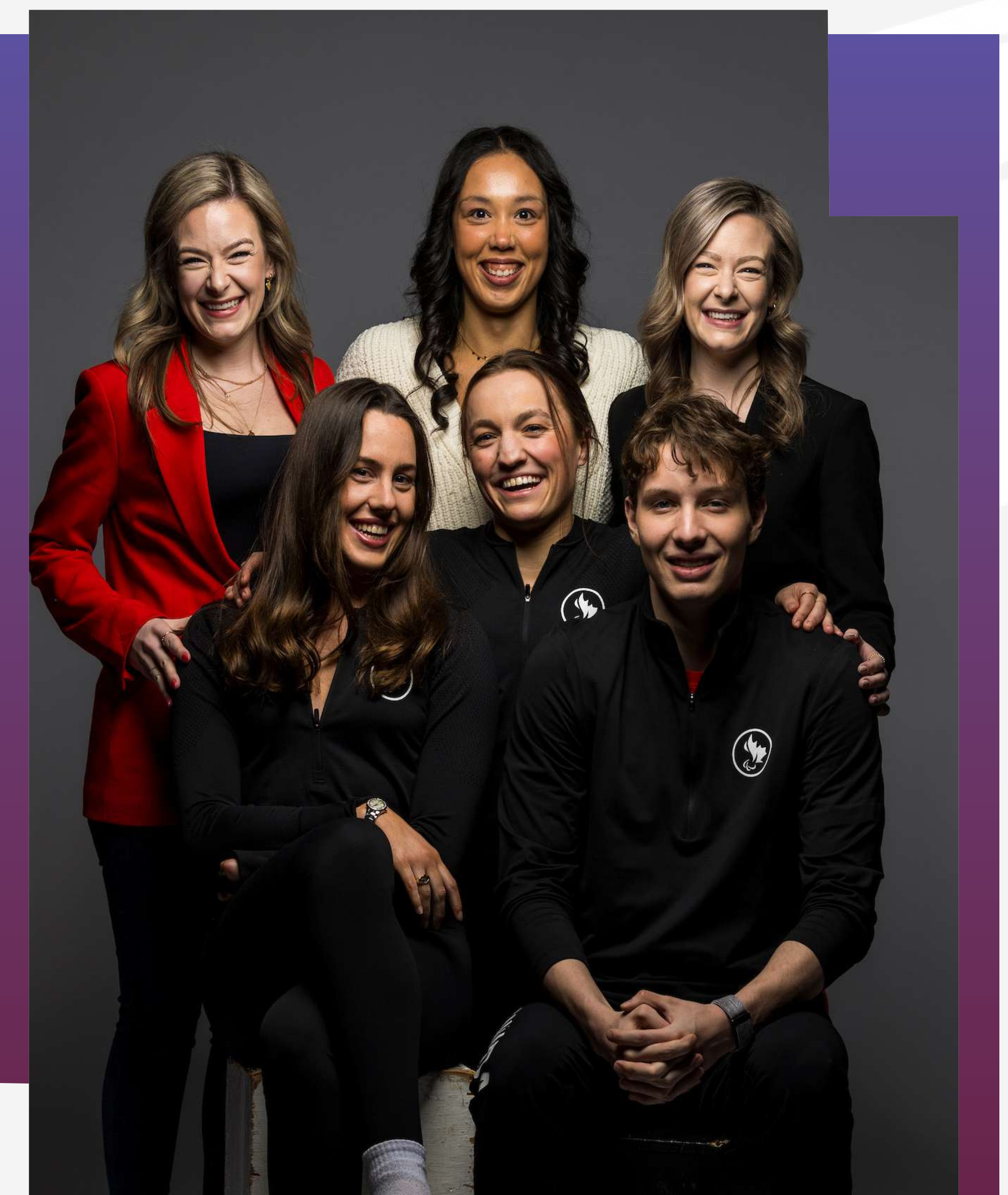
ATHLÈTES ET PERSONNEL DE SOUTIEN DE PARANATATION au Sommet sur le contenu en février 2024